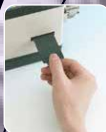
Sensor fácil de limpiar