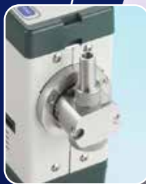
Impactadores para 10 y 4 micras punto límite