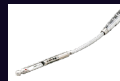
La sonda articulada telescópica se incluye para lugares de difícil acceso.