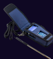
Estuche de manos libres aprobado por OSHA disponible. Model 6000-61